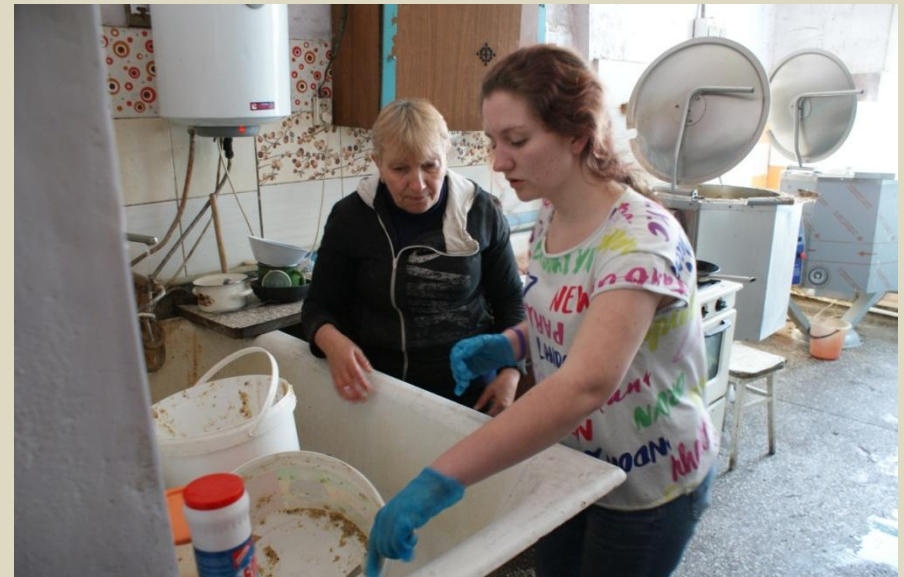
Помощь приюту для бездомных животных «Ласка»