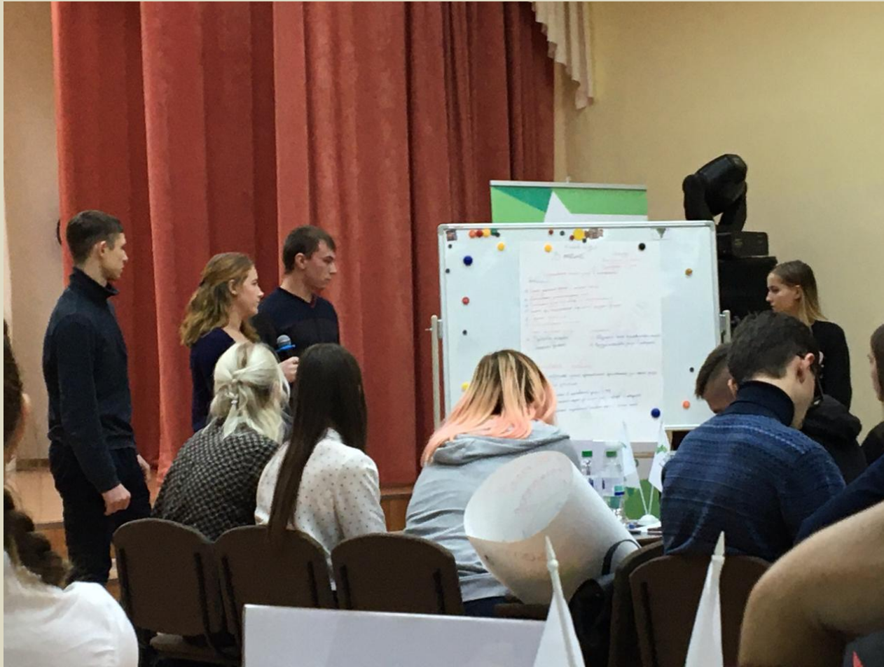
Всероссийская неделя сбережений «Друзи с финансами»