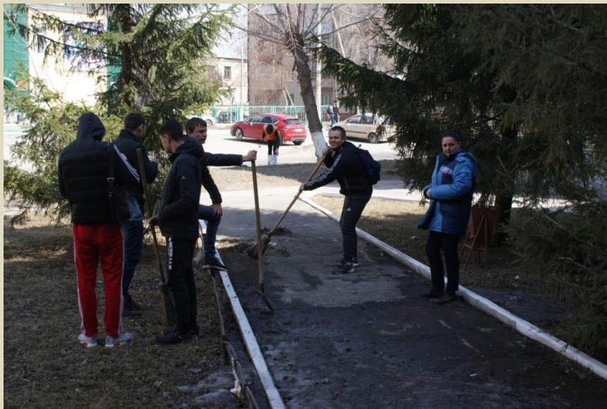
Уборка территории, прилегающей к колледжу