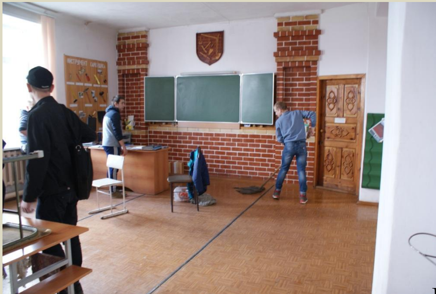
Уборка учебной аудитории