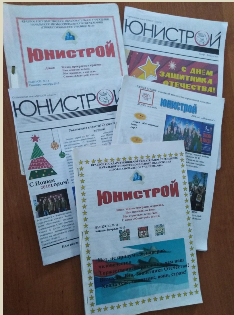
Студенческая газета «ЮНИСТРОЙ»