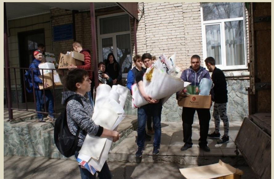
Акция «Береги лес», организованные совместно с командой «Молодежки ОНФ»