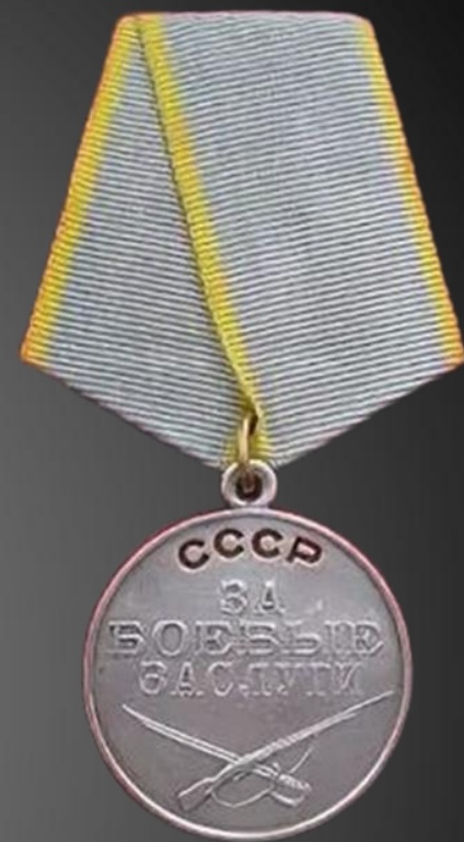
МИТИН ВИКТОР ВИКТОРОВИЧ