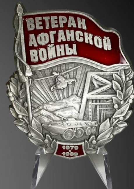
ЖАРИХИН ВИКТОР ВЛАДИМИРОВИЧ