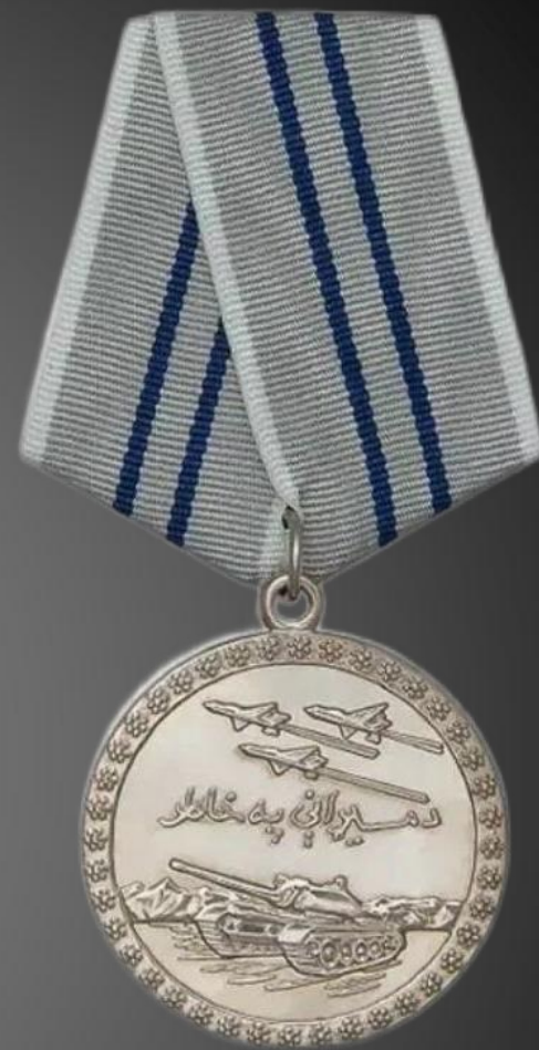
ЧУХВАНЦЕВ НИКОЛАЙ ЛЕОНИДОВИЧ