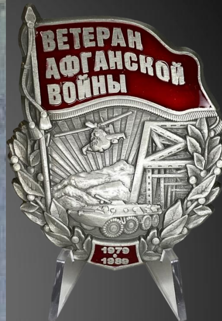
ЛОМАКО ЕВГЕНИЙ БОРИСОВИЧ