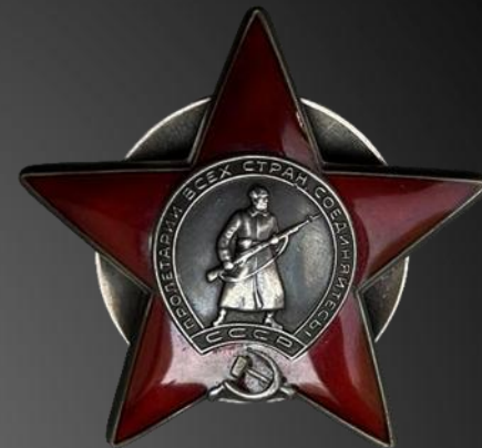
ГВОЗДЕВ ВЯЧЕСЛАВ АНАТОЛЬЕВИЧ