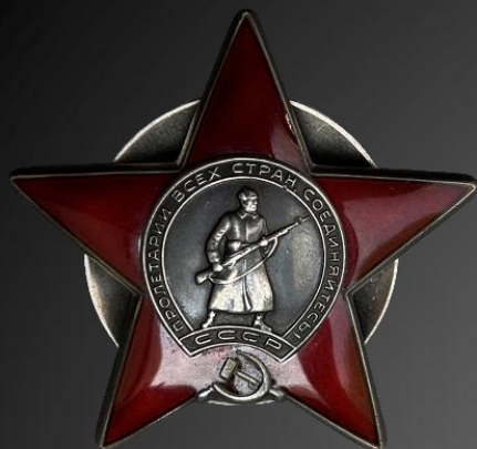
БОГДАНОВ ЮРИЙ ДМИТРИЕВИЧ