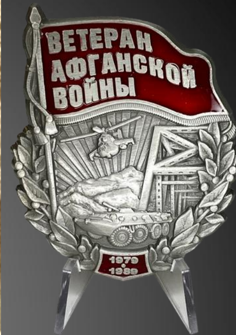
ДЕМЧЕНКО КОНСТАНТИН ВАСИЛЬЕВИЧ