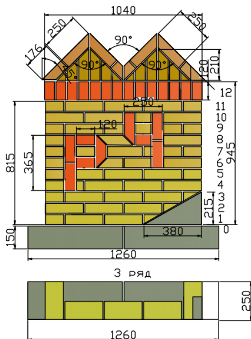
Модуль 2 "РЧ"

Надпись - выступ 15 мм из плоскости модуля Все ряды модуля выполнять в одной плоскости Расшивка швов - вогнутая глубиной 5 мм Расшивка швов надписи - прямоугольная в подрезку (заподлицо) Толщина вертикальных и горизонтальных швов - 10 мм Материалы: кирпич желтого цвета 250x120x65мм - 70 шт кирпич красного цвета 250x120x65 мм - 20 шт кирпич коричневого цвета 250x120x65 мм - 10 шт газосиликатные блоки 625x250x150 мм - 3 шт. раствор известково-песчаный - 0.2 куб.м